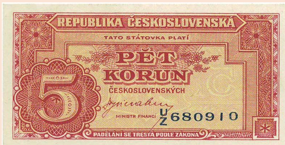
Bankovky platné od roku 1945 až do roku 1953