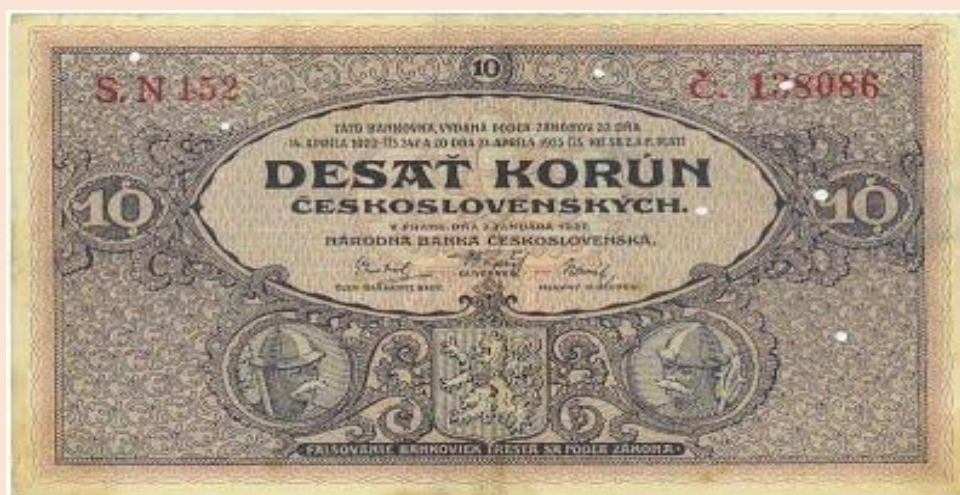
Deset korun měna platná od 1926 – 1939