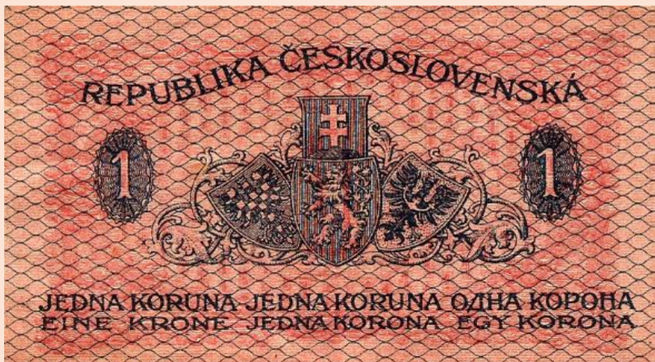
První koruna česká neboli státovka rok 1919