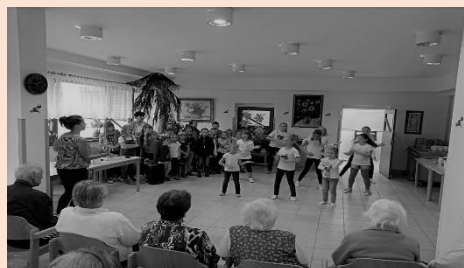
Vystoupení 5. ZŠ

V pondělí 7. 10. 2019 jste se pak mohli nechat okouzlit „Artistic magic show“. Odpoledne plné magie, čar a kouzel muselo okouzlit každého a pevně věřím, že jste se nechali okouzlit.