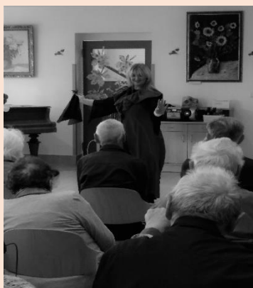
Artistic magic show

V pondělí 7. 10. 2019 jste se pak mohli nechat okouzlit „Artistic magic show“. Odpoledne plné magie, čar a kouzel muselo okouzlit každého a pevně věřím, že jste se nechali okouzlit.