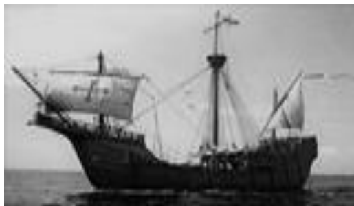
Vlajková lod' Santa Maria