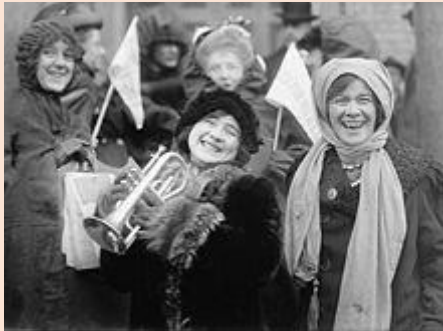
Americké ženy demonstrující za právo volit (únor 1913).

V roce 1893 se stal Nový Zéland (tehdy ještě kolonie Velké Británie) první zemí, která přiznala volební právo ženám. Hned na začátku nového století jej následovala Austrálie. Prvními státy Evropy, jež poskytly ženám volební právo, se v letech 1906–1915 staly Finsko (tehdy autonomní součást Ruské říše), Norsko a Dánsko.